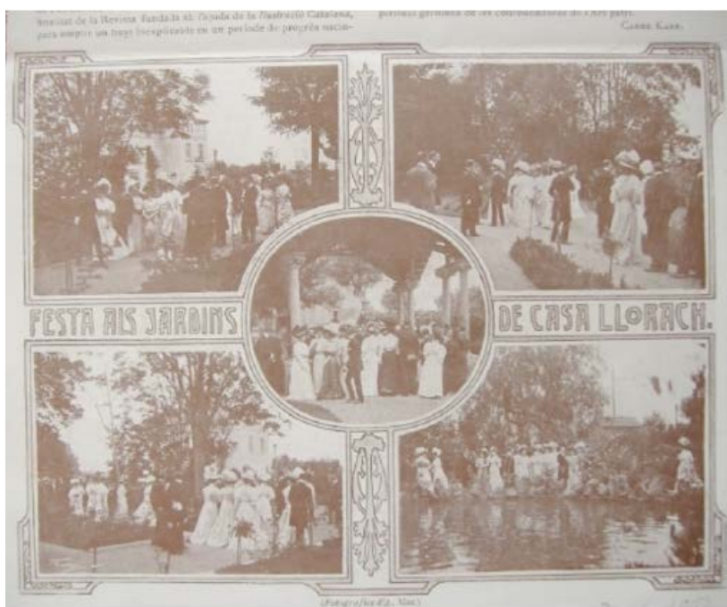
La Il·lustració Catalana - Feminal 1907