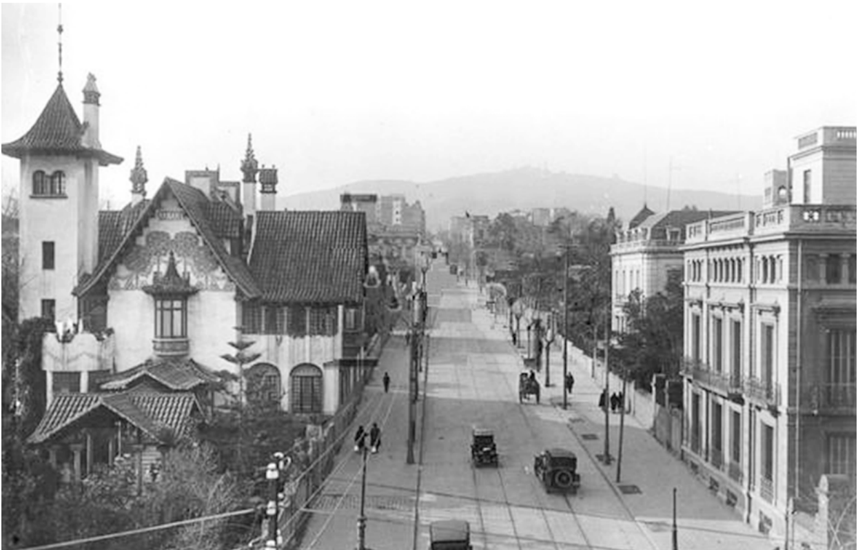
La desapareguda casa Isabel Llorach de Puig i Cadafalch, ubicada a l'actual cantonada del carrer Muntaner amb Travessera de Gràcia

Quan se surt per la porta del Col·legi d'Aparelladors de Barcelona (CAATEEB) i es camina unes passes fins al carrer Muntaner es contempla un paisatge radicalment urbà densament conformat per edificis entre mitgeres i gratacels ben compactats. Costa imaginar-se que només unes dècades enrere s'hi hauria vist una cosa ben diferent.